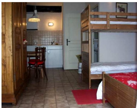
Aménagée comme un studio. Au sud, côté village

4 personen : 2 volwassenen - 2 kind(eren)