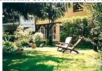
Accès libre au jardin...