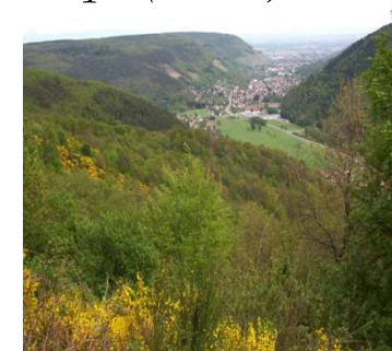
La vallée de Guebwiller