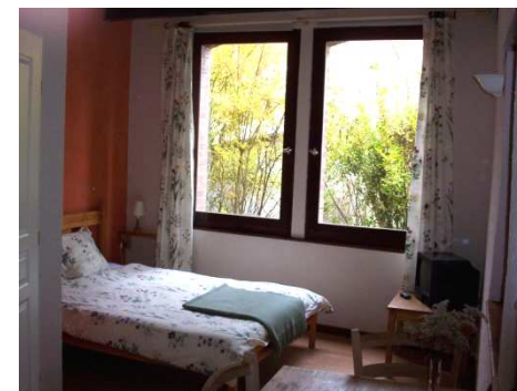
Chambre côté jardin, au bord de l'eau