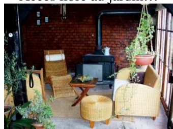
...Et au jardin d'hiver (non chauffé)