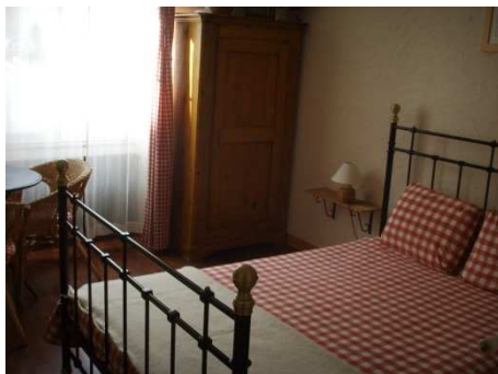
Chambre exposée sud, côté village

3 personen : 2 volwassenen - 1 kind(eren)